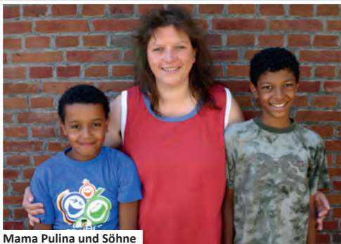
Mama Pulina und Söhne