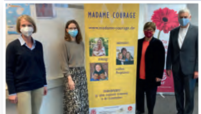
Spendenübergabe durch die St. Antonii Erzbruderschaft Münster

Für Madame Courage heißt es einerseits den erhöhten Bedarf der Studierenden zu decken sowie eine Reihe neuer Förderungsanfragen zu finanzieren. Andererseits sind aber die Möglichkeiten zur Spendenakquise durch den Wegfall öffentlicher Veranstaltungen äußerst begrenzt.