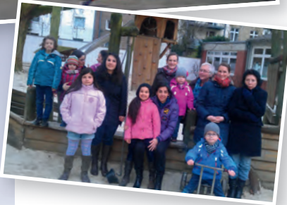
Die jährlichen Treffen der Stipendiat*innen bieten Gelegenheit zum Austausch – und auch die Kinder haben ihren Spaß