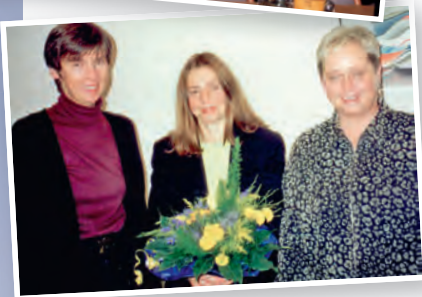
Grund zum Feiern: Die Gründung von Madame Courage (o.) und die erste Spendenvergabe 1999