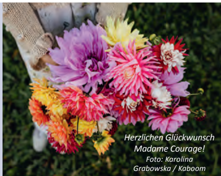
Herzlichen Glückwunsch Madame Courage!