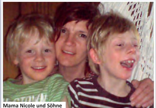
Mama Nicole und Söhne