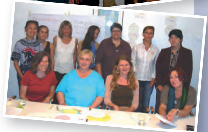
Absolventinnen der Wirtschaftswissenschaft überreichen einen Spendenscheck (o.)