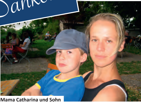
Mama Catharina und Sohn

„Ich bedanke mich ganz herzlich bei den Frauen von Madame Courage. Durch die guten Beratungen bei verschiedenen Fragen, die bei mir als Studierende mit Kind auftauchen, fand ich wieder eine gute Perspektive und schöpfte Hoffnung. Danke dafür und für die finanzielle Unterstützung.“