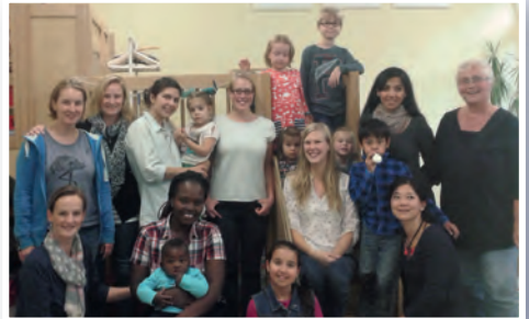
Bereit für die Karriere: Stipendiat*innen von Madame Courage beim Erfahrungsaustausch

Unsere Vision ist die Vereinbarkeit von Elternschaft und qualifiziertem Studienabschluss. Insbesondere Alleinerziehende sollten sich nicht gezwungen sehen, ihr Studium aus finanziellen Gründen abbrechen zu müssen. Auch sie sollten ihre Karrierechancen durch einen Studienabschluss wahren und somit nachhaltige Zukunftsperspektiven für sich und ihre Kinder schaffen können.